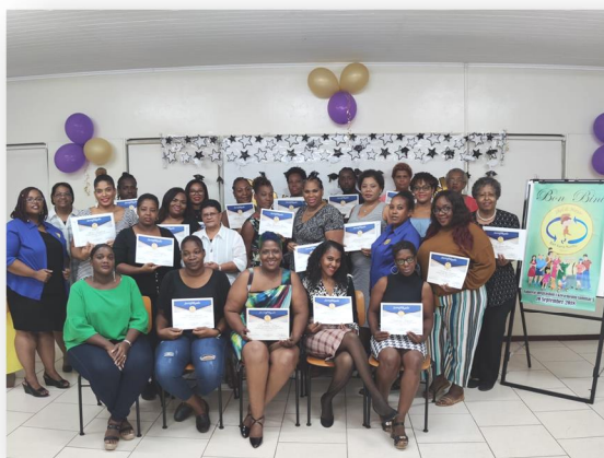
Grupo di Skol di Mayor ku a risibí nan sertifikado ougùstùs 2020

Tur esaki komo meta pa tin mihó relashon entre mayor i yu , ku ta kontribuí na un mihó skol i un mihó komunidad. Nos ta konta riba mayornan su partisipashon.