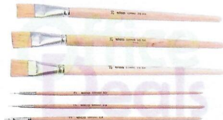
kwasten met varkenshaar